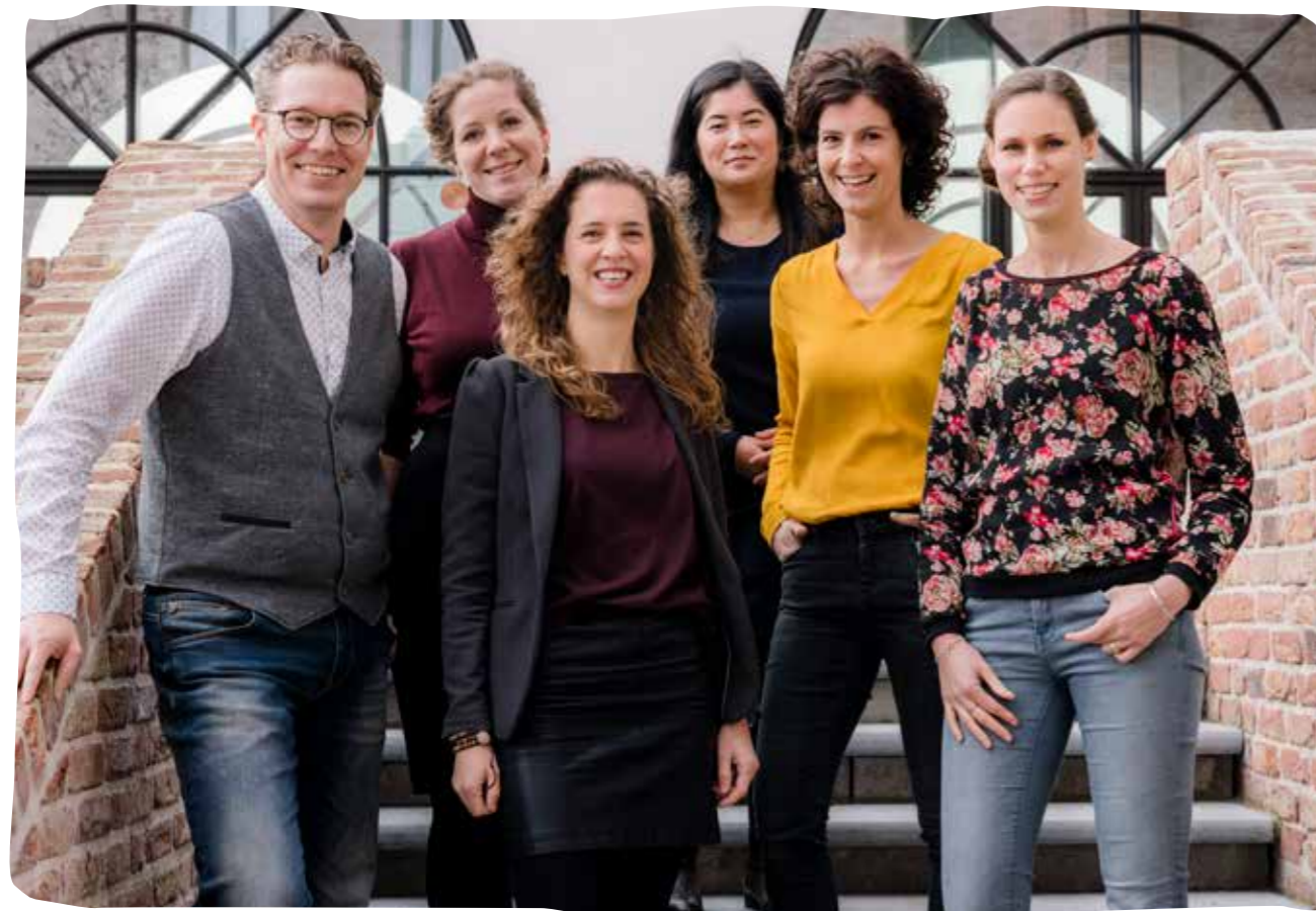
Boven: Kernteam van Pit Cultuurwijzer.

De verbindende, en de daarbij regelende, rol voor